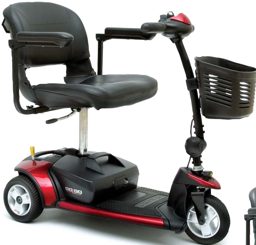
Go-Go Elite Traveller®, 3-ruedas

El diseño compacto del Go-Go Elite Traveller® permite maniobrar rápidamente en espacios reducidos proporcionando también excelente estabilidad en exteriores. Verifique la facilidad de viajar con su mecanismo único de fácil desmontaje y en 5 piezas. Viaje a donde quiera con Go-Go Elite Traveller.