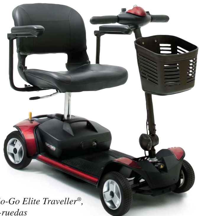
Go-Go Elite Traveller®, 4-ruedas